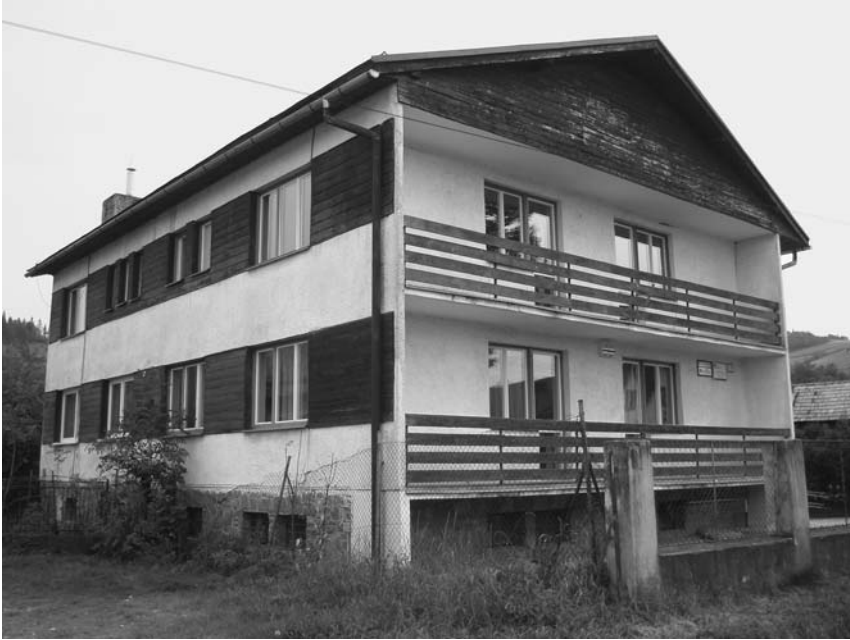
Fot. 3. Objekt Správy PIENAP-u v súčasnosti. The Pieniny National Park building office today.

hlavné zameranie jeho činnosti v minulých rokoch. Kým v období od roku 1967 až do roku 2000 do územnej pôsobnosti PIENAP-u patrilo len územie národného parku a jeho ochranné pásmo. Po roku 2000 sa územná pôsobnosť rozšírila aj o voľnú krajinu a maloplošne chránené územia územia okresov Kežmarok a Stará Ľubovňa, ktoré nie sú súčasťou územia TANAP-u a jeho ochranného pásma.